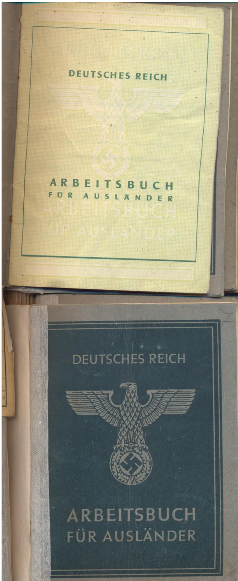
Трудовая книжка оstarбайтера. ГАДО, ф.Р-4550, оп.1, д.13