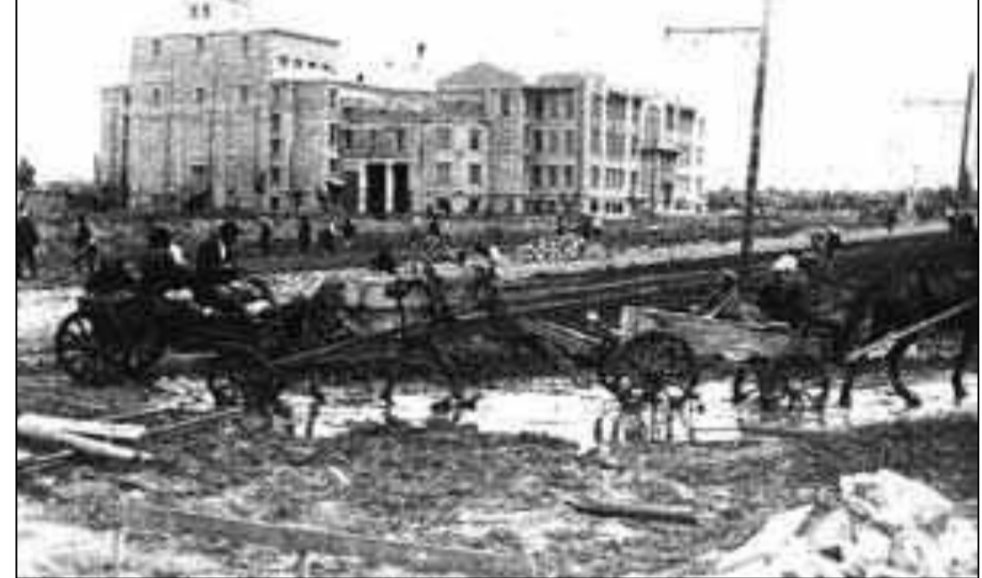
Горловка. Дворец культуры. 1932 год

За годы первой пятилетки подверглись реконструкции и увеличили производство предприятия ртутного и доломитного комбинатов. В 1928 году начал работать Горловский коксохимический завод, который был не только производителем кокса и различных исходных продуктов химии, но и поставщиком коксового газа — сырьевой базы для строившегося в Горловке азототукового завода, первая очередь которого вошла в строй в первом квартале 1933 года.