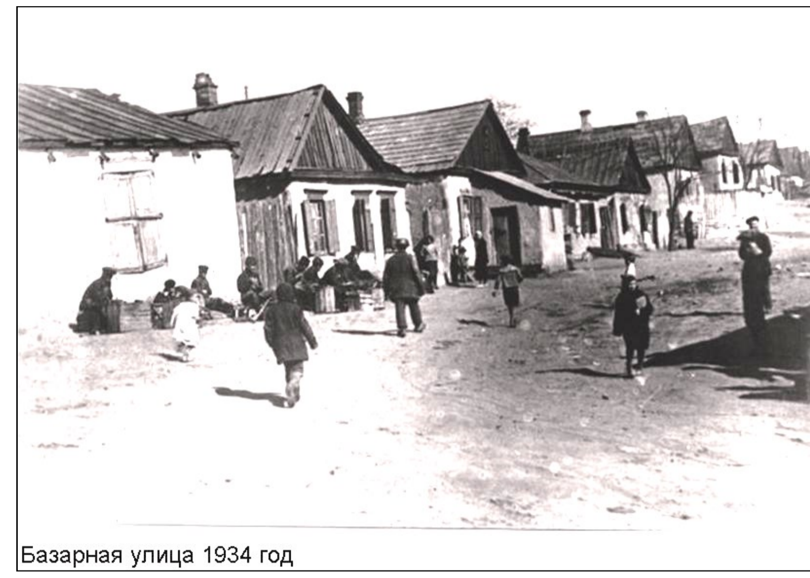
Базарная улица 1934 год

В 1925 году из шахтных и заводских посёлков был создан районный центр Горловка с населением 27,3 тыс. человек (с посёлками — 40,5 тыс. жителей). В то время шахтами Горловки добывалось 2,2 млн. тонн угля в год. В годы индустриализации (конец 20-х — начала 30-х годов) в Горловке проходила реконструкция старых и появление новых предприятий, велось крупное промышленное строительство: в 1928 году — коксохимический завод, в 1932 году — шахта имени Румянцева, в 1933 году — шахта «Кочегарка», в апреле 1933 года — азотно-туковый завод имени Серго Орджоникидзе, в том же году — крупнейший в мире цех по производству врубковых машин (3 тыс. штук в год) на машиностроительном заводе. В 1941 году вступила в строй крупнейшая в Донбассе шахта № 4-5 «Никитовка».