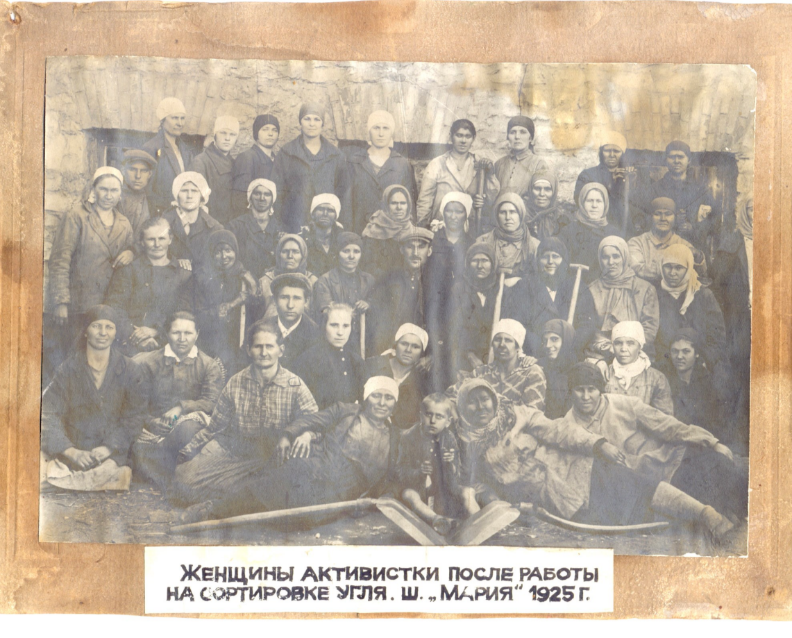
Женщины-лаборанты после смены на шахте Свердловской № 22. Май 1925 г.