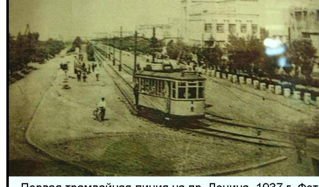
Первая трамвайная линия на пр. Ленина, 1937 г.