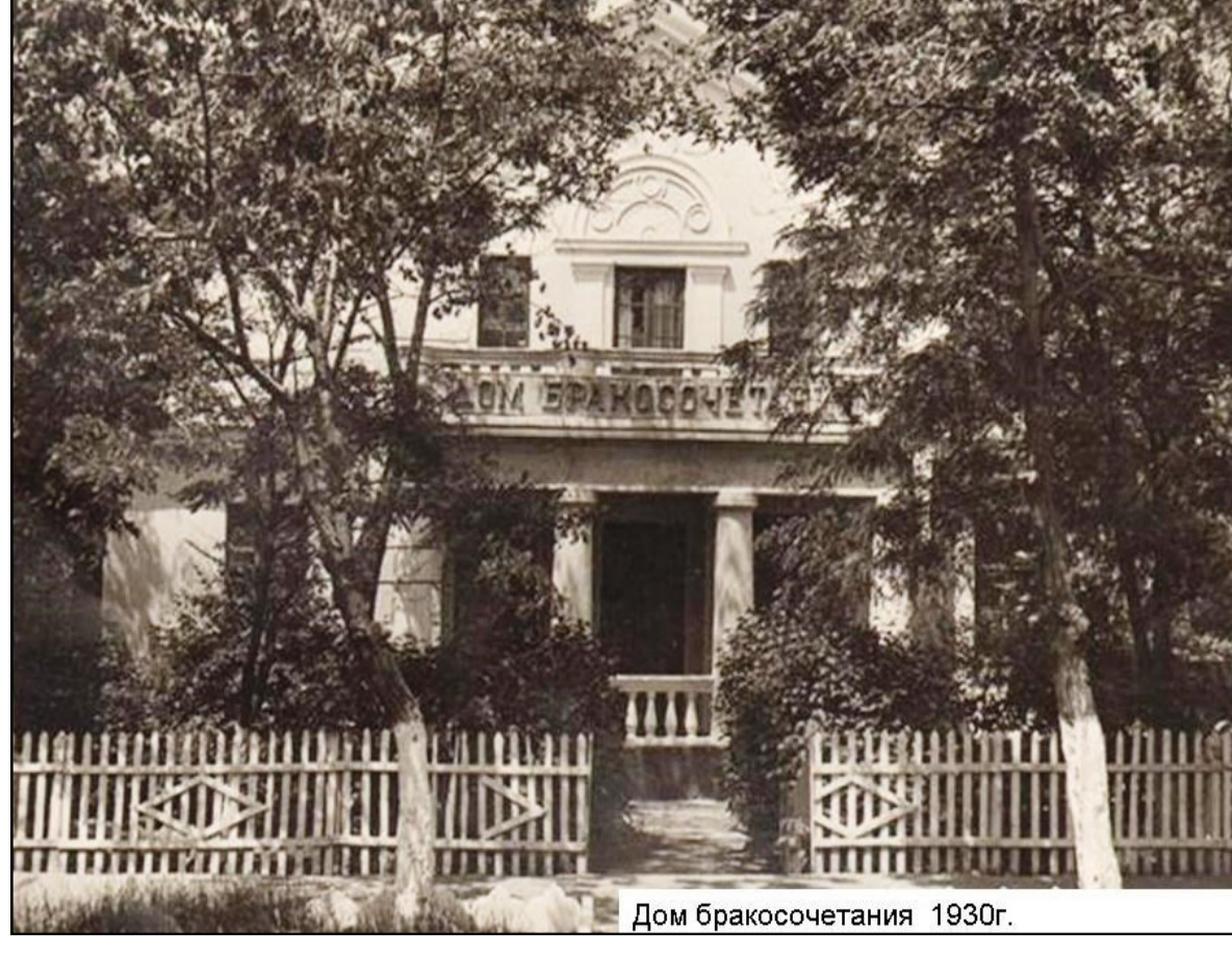
Дом Советов 1936 год