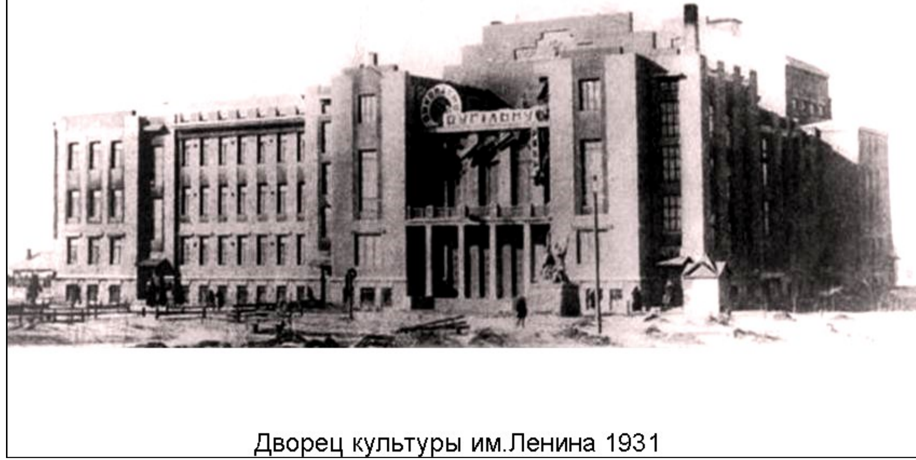
Дворец культуры им. Ленина 1931