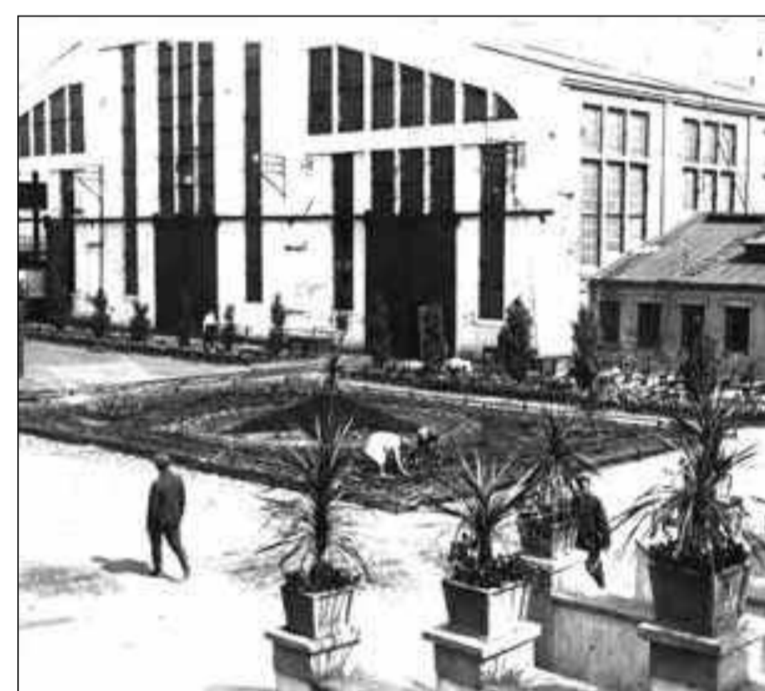
Горловка. Машзавод. 1932 год